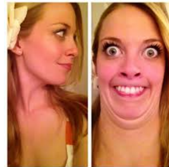
szép / csúnya