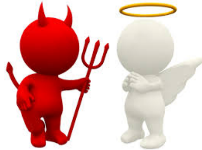
rossz / jó