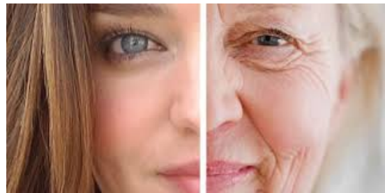
fiatal / öreg