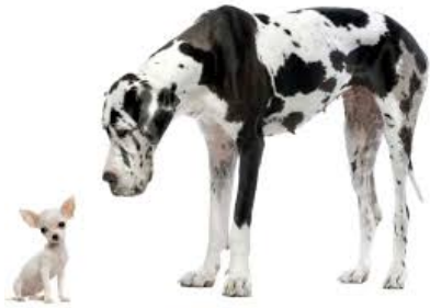
kicsi / nagy