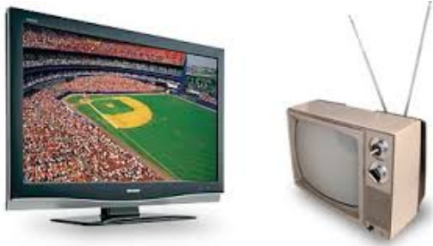
új / régi