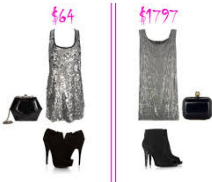
olcsó / drága