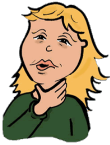
fáj a torkom