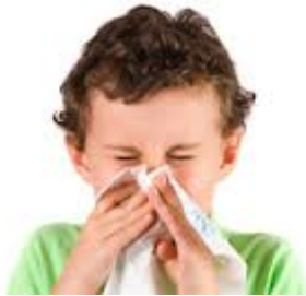
náthás vagyok / folyik az orrom