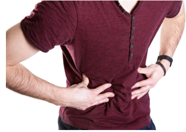
fáj a hasam