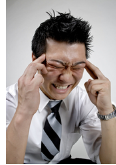
fáj a fejem